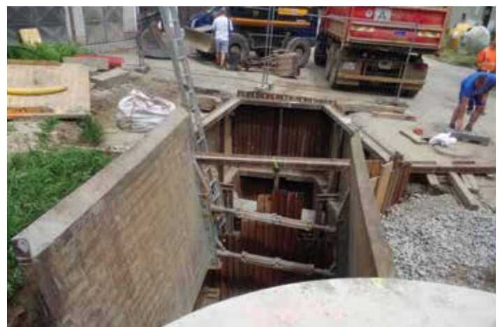
Silně zahlubněný a poměrně složitý objekt „přečerpačky“