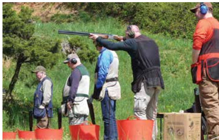
Skoro padesát střelců v Kokorách.

Pořadatelé vyhodnotili výsledky soutěže, předali soutěžícím věcné ceny a soutěž ukončili. Rád bych touto cestou poděkoval obci Kokory za spolupráci a sponzorům za příspěvek na ceny pro závodníky. Dík patří také všem, kteří se na akci podíleli.