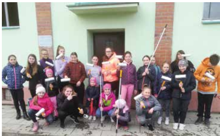
Pozor, dnes se nehraje, dnes se maluje. Za klubovnu krásnější.