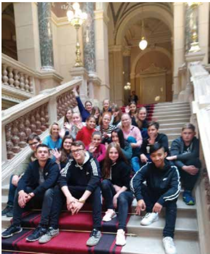
Na schodech v Národním muzeu.

Praha, hlavní město České republiky, se stala výletním cílem žáků sedmé, osmé a deváté třídy naší školy. Ve čtvrtek 16. května jsme po ospalé jízdě v Leo expresu vystoupili na hlavním nádraží a vydali se směr Václavské náměstí. Zde jsme navštívili Národní muzeum, konkrétně jsme zhlédli výstavu s názvem Hej, Československo!