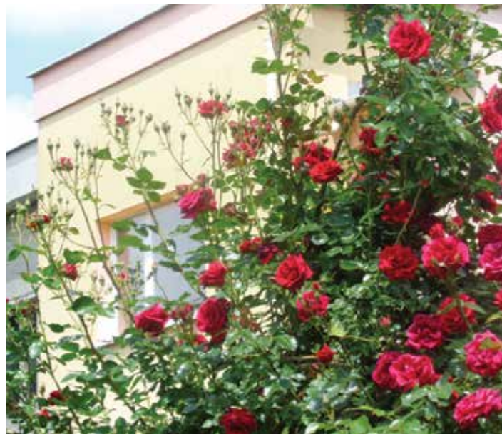
Ptáčkovy popínavé růže přivábí naši pozornost svou výraznou barvou a svěžestí každý rok.

Děkujeme přírodě za tu možnost zachytit i do našich „obyčejných“ obecních novin trochu té krásy kolem nás. To se nám snad podařilo i v posledních číslech Kokorských novin nejen několika snímky kvetoucích kokorských zahrad, ale i přírody kolem obce, dokonce i na titulních stranách. Víme, že je to jen zlomek nejrůznějších květů a zeleně, ale alespoň to. Jen náhodou vedly tulipány. Královnou nastupujícího léta však zůstávají růže. Tentokrát jsme se spokojili s domácí zahradou redakce a snímkem od sousedů. Rádi však přijedeme fotografovat na pozvání i k vám.