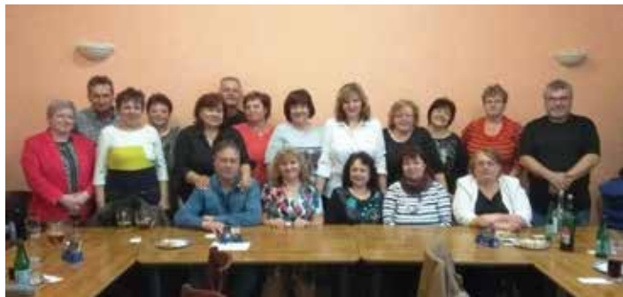
Veselé tváře účastníků dokreslují toto pohodové setkání.