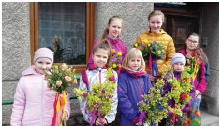
Kokorská děvčata s krásnými jedličkami 2019.

Kluci už opravdu získali v našich KN prostoru dost. Díky další fotografii od paní Ing. Růženy Jurečkové se dostalo i na děvčata. K dispozici máme i video, na kterém děvčátka i slečny opravdu pěkně zpívají tu známou velikonoční, kterou jsme slyšovali na květnou neděli i před 50 a více lety – „Když Pán Ježíš na oslátku do Jeruzaléma jel...“