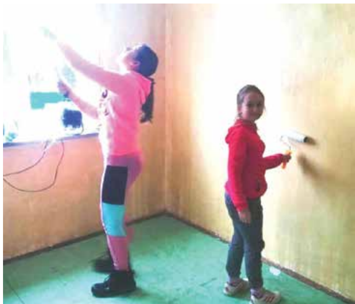
Okna musí být čistá a barevné stěny bez čmouh.