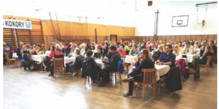
Plný sál a pohoda. Maminky všech generací si to přeče zaslouží.