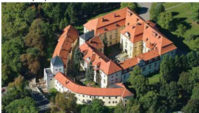
Někdejší sídlo šlechtického rodu, potomků slavného generála.

Rádi přibližujeme našim čtenářům zajímavé zámky neřiliš vzdálené. Tentokrát jsme se virtuálně vypravili na zámek Laudonů (...generál Laudon jede přes vesnici...), který leží od naší obce ve vzdálenosti asi 28 km, přes Přerov a Dřevohostice. Snad tato nápověda postačí. Počkáme si na obvyklou odezvu, kolik čtenářů uhodlo, nebo zámek poznalo. Těšíme se na vaši spolupráci.