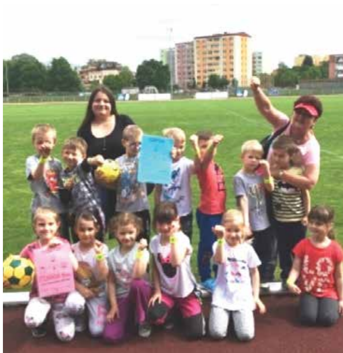
Naši nejmenší na „velikém stadionu v Přerově. Škoda snížené kvality snímku.