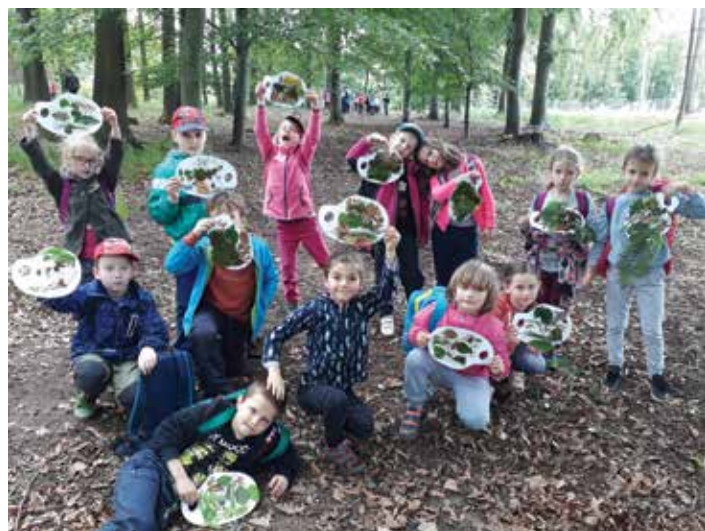
V lese obce Kokory je příjemně a tolik zajímavého a nového.