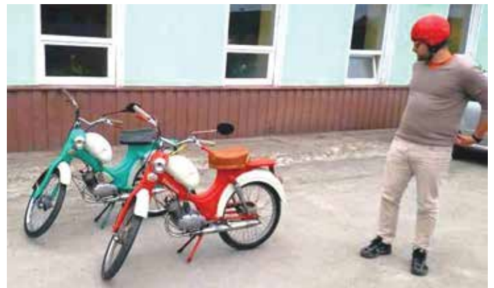
Přílba barevně ladí, tak tedy vzhůru na náročnou trasu.