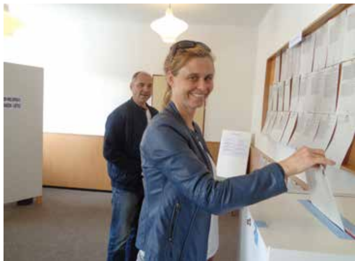
Volte správně – lepší Evropu - a nechte si poradit.

Velmi poklidně proběhly v obci volby do „Evropy“, výsledky jsou k dispozici v médiích a v Kokorách se příliš nelišily od celorepublikového obrazu. V tradiční volební místnosti na OÚ nebyl žádný nával a tak jsme zcela náhodně zachytili jednu „rodinnou volbu“.