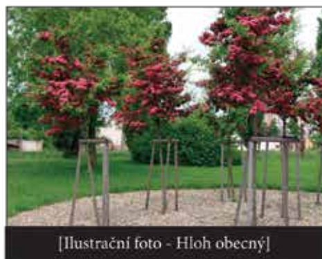
[Ilustrační foto - Hloh obecný]

V minulém čísle jsme Vás informovali o plánech na revitalizaci zeleně v obci po výstavbě kanalizace. Koncem května jsme žádali o poskytnutí grantu skupiny ČEZ z grantového programu „Stromy 2019“ na podzimní výsadbu. Ten pomáhá financovat liniovou výsadbu stromů i keřů na vrácení zeleně do krajiny a snížení hluchosti a prašnosti.