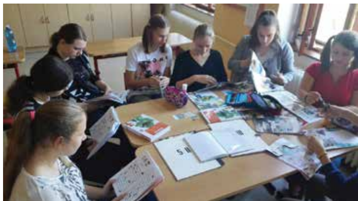
Děvčata chválíme. Bohužel, část mládeže čte velmi málo.