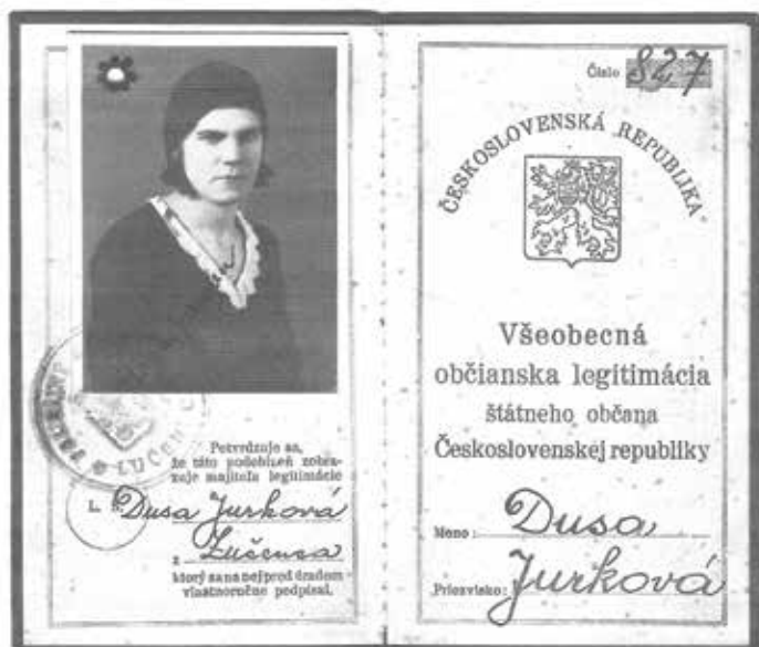
Z rodinného archivu.