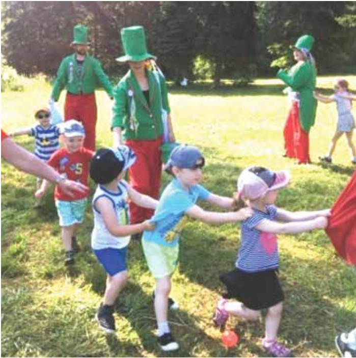
Děti z MŠ Kokory a vodníci z Litovelského Pomoraví