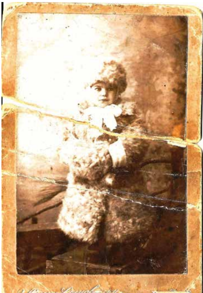
Ateliér v Chabarovsku, Přímoří.

Fotografii Jevdokie jsme nijak neupravovali. Vypovídá o tom, co tuhá deska foto v bouřlivém čase prodělala. 15 let na Dálném východě, cestu kolem světa po moři a sto let u čtyř generací nové legionářské rodiny v naší republice.