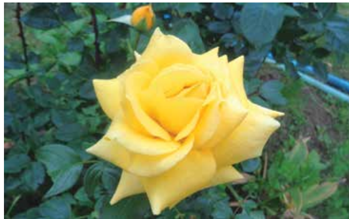
Decentní, elegantní a jemná žlutá (snad čajová) růže je po léta ozdobou zahrady redakce.