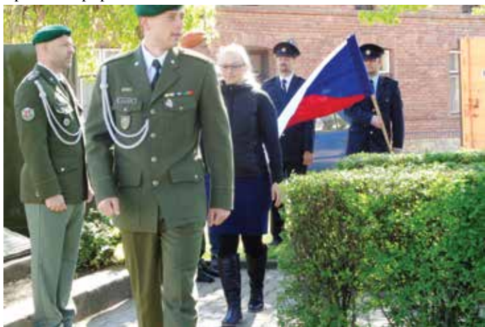
Vzpomínka u pomníku padlých

Před 74 léty, 8. května 1945, skončila vítězstvím spojenců protihitlerovské koalice prakticky II. světová válka v Evropě. V tento den byly osvobozeny sovětskou armádou i Kokory. Nejen toto velké vítězství nad fašismem, ale i hrdinství a krev prostých vojáků a utrpení či smrt milionů civilních obyvatel mnoha zemí, ale i jejich statečnost, to vše si s pohnutím připomínáme i v naší obci.