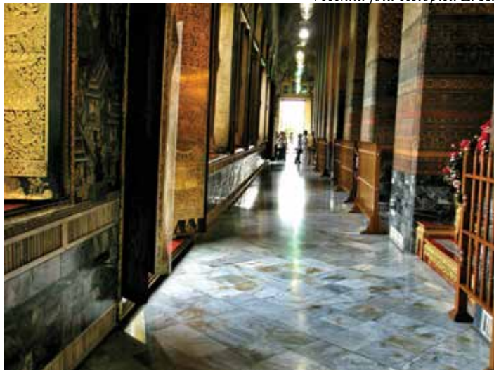
Důstojný buddhistický chrám.

Poprvé sedím v tuk-tuku a osmimilionovým velkoměstem uháním do chrámu Wat Traimit za největším zlatým Budhou na světě. Dovede si představit úctyhodných 46 metrů na délku, 15 metrů na výšku a 5,5 tuny ryzího osmnáctikarátového zlata? K neuvěřitelné soše se váže ještě neuvěřitelnější příběh. Zlatý Budha vznikl okolo 13. století. O 500 let později byl ve městě Ayutthay kvůli ochraně před lupiči natřen černým lakem, pokryt silnou vrstvou štuky a upadl do zapomnění. Dokonce i barmští nájezdníci nechali při plenění Budhu zcela bez povšimnutí. V roce 1955 při převozu do chrámu v centru Bangkoku se přetrhlo lano, na kterém socha visela a při pádu kus štuky odpadlo. V šoku byli nejen dělníci, ale i celá země. Po Thajsku se strhla zlatá horečka, které padlo za obět mnoho jiných Budhů. K podobnému nálezu však už nikdy nedošlo.