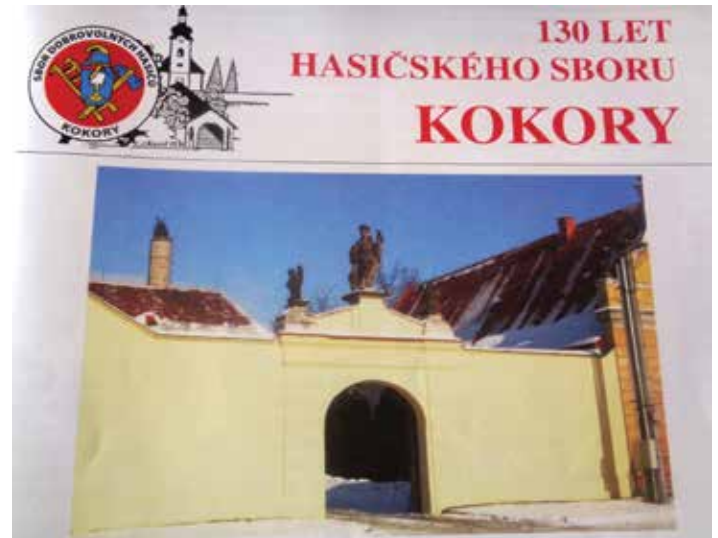
Svatý Florián ochraňuje Kokory před požárem už více než 250 let.