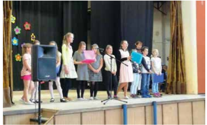
Zazpíváme maminkám i babičkám.

Poté následovalo volné odpoledne s cimbálovou muzikou. Občerstvení zajistil Sokol Kokory. Snažili jsme se vytvořit příjemné odpoledne pro všechny naše maminky bez rozdílu věku a vyjádřit tak obrovskou úctu mateřské roli ženy v naší společnosti.