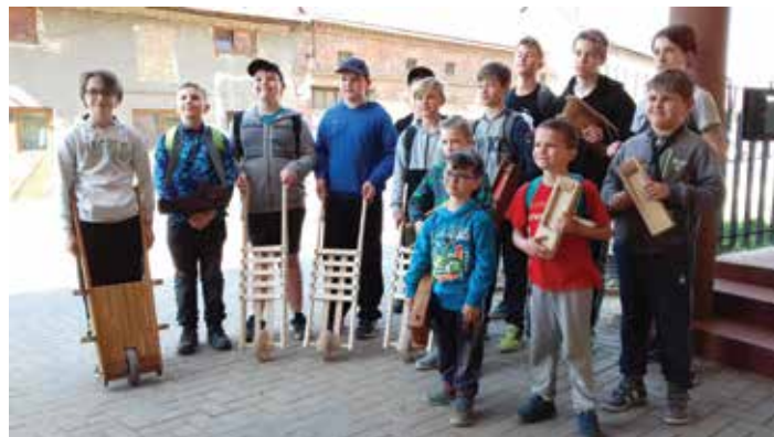
Tady to ovšem vypadalo úplně jinak. Otevřeli, za náhradu zvonů poděkovali a „brkače“ odměnili, jak se v Kokorách sluší a patří.

Nemůžeme se nezmínit o jednom jevu, z našeho pohledu negativním. Kluci si trpce povzdechli: „Bohužel nám při vybírání v mnoha domech ani neotevřeli“. Zavádění této „řádoby moderní“ tradice je i z historického a lidského hlediska smutné.