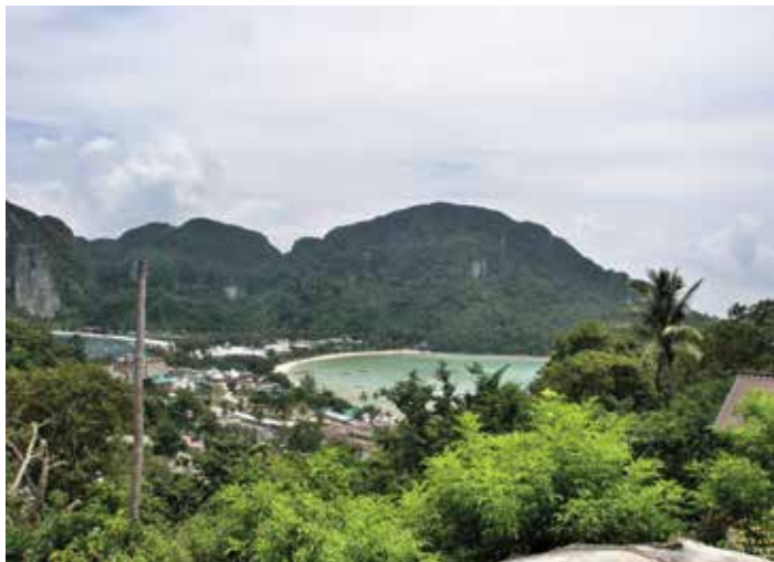
Výhled na ostrov.