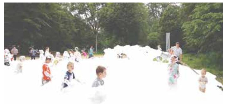
Sníh a v létě? Na dětském dni je to, díky hasičům, možné.

V sobotu 1.6. 2019 od 14 hod. na Starém hřišti pod Bramborem uspořádali členové hasičského sboru ve spolupráci s Obcí Kokory a místními spolky ke Dni dětí různé soutěže, a to jak vědomostní, tak i sportovní. Velký zájem dětí byl již tradičně o myslivost. Dále mohly zájemci zkusit rýžování zlata nebo tvoření bublin z připraveného roztoku. Za splnění všech disciplín obdržely děti odměny, které věnovala Obec Kokory a další sponzoři, za což jim patří poděkování. Závěrečné opékání špekáčků a hasicí pěna byly pro děti dovršením zábavy a krásného odpoledne.