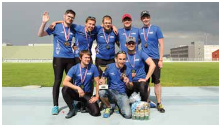
A teď už hurá na mistrovství republiky.