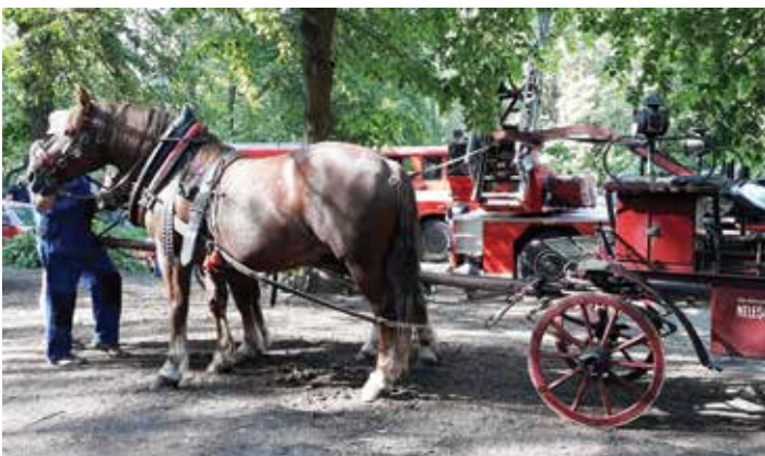
Hosté z Nelešovic tradičně nezklamali. Důstojná historická a moderní hasičská technika na starém hřišti vedle sebe.