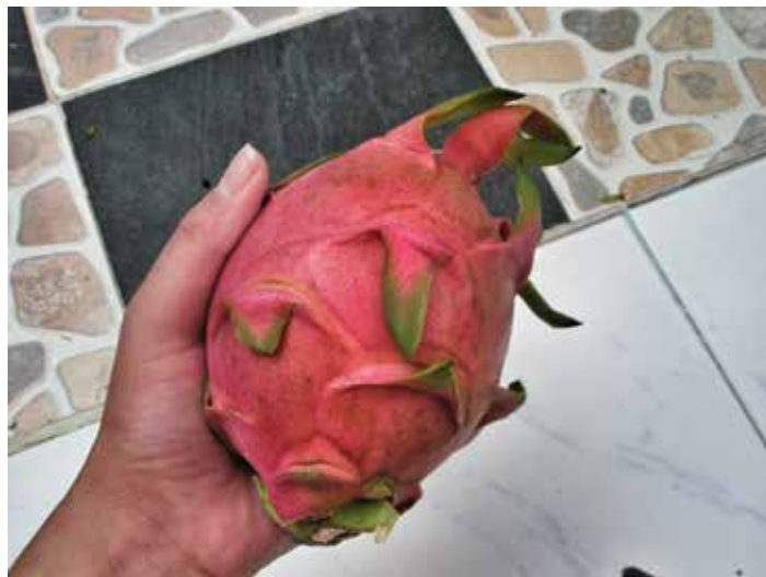
Takové „dračí“ ovoce většina z nás nikdy neviděla.

Po výšlapu na kopec nad městem, jsme odměněni nádherným výhledem. Ostrov má tvar motýlích křídel spojených krásnou úžinou. V roce 2004 se však tudy přelila vlna tsunami a celou oblast zničila. Dnes je vše opraveno a po hrůzné katastrofě nejsou žádné stopy.