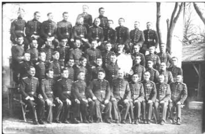
Z rodinného archivu. Foto neupravováno.