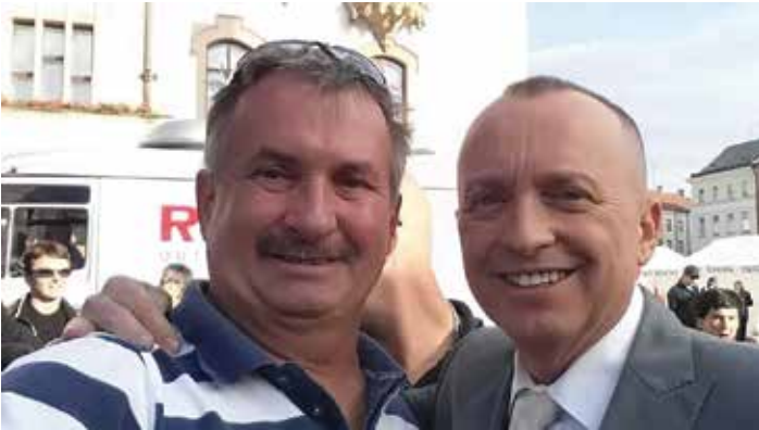
Hlavní hvězdy televize PRIMA před časem v Přerově.

Ze starých zásob, ale také z novějších fotografií archivu O. S.